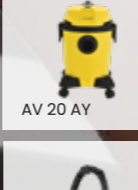
AV 20 AY