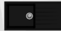
AS 8105 CB