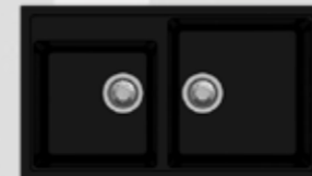
AS 8865 DB