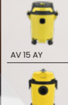
AV 15 AY