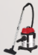
AV 15 BR