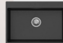
AS 8615 BB