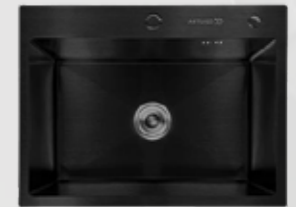
AS 5604 BB