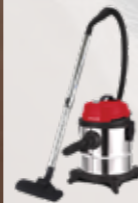
AV 20 BR