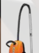
AV 2020 O