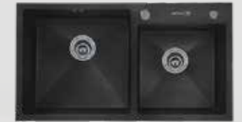
AS 5824 DB